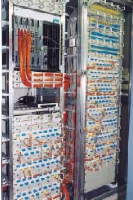
Das Wirecenter für die Telefon- und PC-Verkabelung

Team zunächst darüber klar werden, ob ein Cablessharing gewünscht ist oder nicht, ob also jeder Anschluß ein eigenes Kabel mit acht Adern erhält oder ein Kabel für zwei Anschlüsse genutzt werden sollte. Eine Kapazitätsberechnung