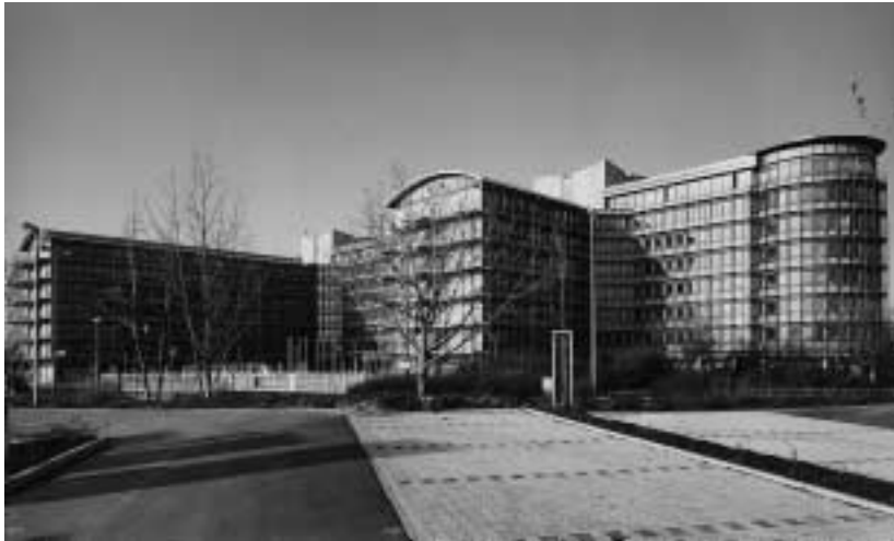
Der Neubau der Frankfurter Hauptverwaltung von ITT Automotive Europe

PATCH-FELDER UND DATENDOSEN Bei der Spezifikation für die Patch-Felder und Datendosen mußte sich das