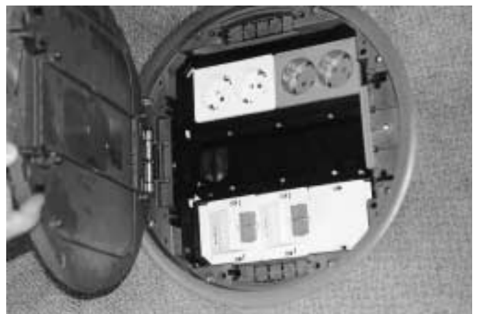
Bodentank mit vier Anschlüssen für Telefon- oder EDV-Endgeräte

kabel sehr groß ist, legten die Planer im Vorfeld der Installation zunächst ihr Augenmerk auf die Festlegungen für die Etagenverkabelung. Das Kabel sollte zum Beispiel ein unkritisches Verhalten im Brandfall aufweisen, also keine Halogene (griechisch: Salzbinder) enthalten, um das Entstehen von toxischen Gasen und Rauch zu minimieren. Außerdem sollte sichergestellt sein, daß das Kabel keinen Brand selbständig weiterleitet und sich womöglich ein Feuer über die Kabelwege unkontrolliert im ganzen Gebäude ausbreiten könnte. Zudem sollte es eine geringe Brandlast aufweisen, um Grenzwerte in Büroräumen leichter einhalten zu können. Kabel, die diese Anforderungen erfüllen, tragen unter anderem die Bezeichnung FRLSOH